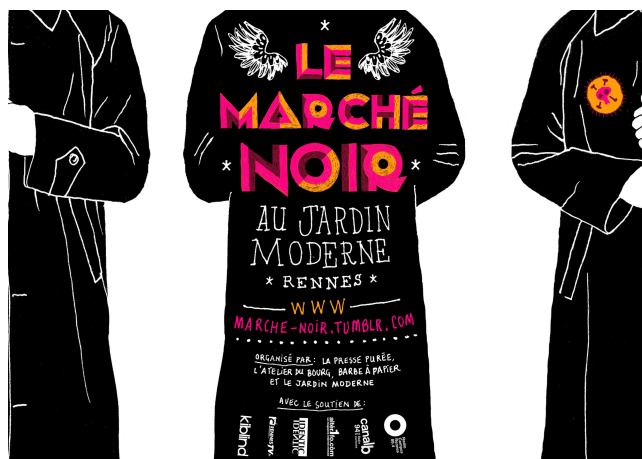
L'Atelier du Bourg

événement de 3 jours consacré à la micro-édition manufacturée et indépendante, en partenariat avec L'Atelier du Bourg, L'Atelier Barbe à Papier et La Presse Purée.