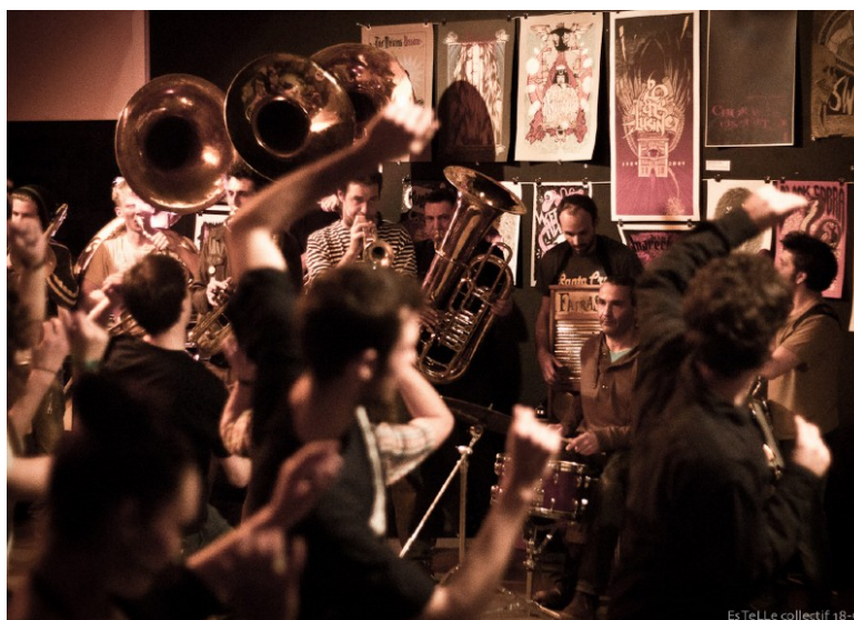
Es TeLLe collectif 18-55 Collectif 18-55

L'ATM (Association Trans Musicales) L'Antipode-MJC, Les Champs Libres, La Bibliothèque Lucien Rose L'Université de Rennes 2, Electroni [K], Les Bouillants, Le Collectif Superstrat, L'Oeil d'Oodaaq, L'EESAB, L'École Moulin du Comte, Le Rectorat de Rennes / Délégation académique à l'éducation artistique et culturelle La Ligue de l'Enseignement 35, Le SPIP 35, La PJJ Rennes, Le CPH Rennes Vezin, La Maison Verte Villejean, Radio Campus Rennes, 3 Hit Combo, Hackable Devices, Ping, L' Atelier du Bourg, L'Atelier Barbe à Papier, La Presse Purée Codelab, La Cantine Numérique Rennaise Les Petits Débrouillards, Tetalab Toulouse Hacknowledge, Actux, West Indie Collective Breizh Entropy.